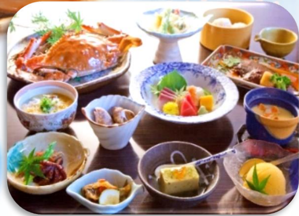
※コース料理一例 写真はイメージです